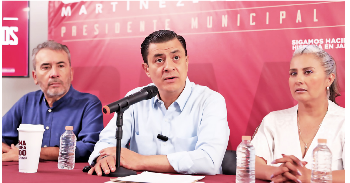
Bono de paz, senderos seguros, autobuses rosas y más de 50 mil luminarias, son parte de las propuestas.

Aseguró que habrá al menos mil policías más patrullando las calles de la ciudad quienes, al igual que los actuales uniformados en Guadalajara, contarán con un Bono de Paz como estímulo por su labor. También, refirió que se habilitarán 7 mil cámaras con inteligencia artificial para fortalecer el sistema de videovigilancia C4, se instalarán 50 mil luminarias para alumbrar los barrios, se habilitarán 10 nidos de mediación en centros comunitarios para la resolución de conflictos y habrá al menos dos centros de integración en favor de la ciudadanía, con servicios como lavandería, artes, desarrollo de capacidades diferentes y