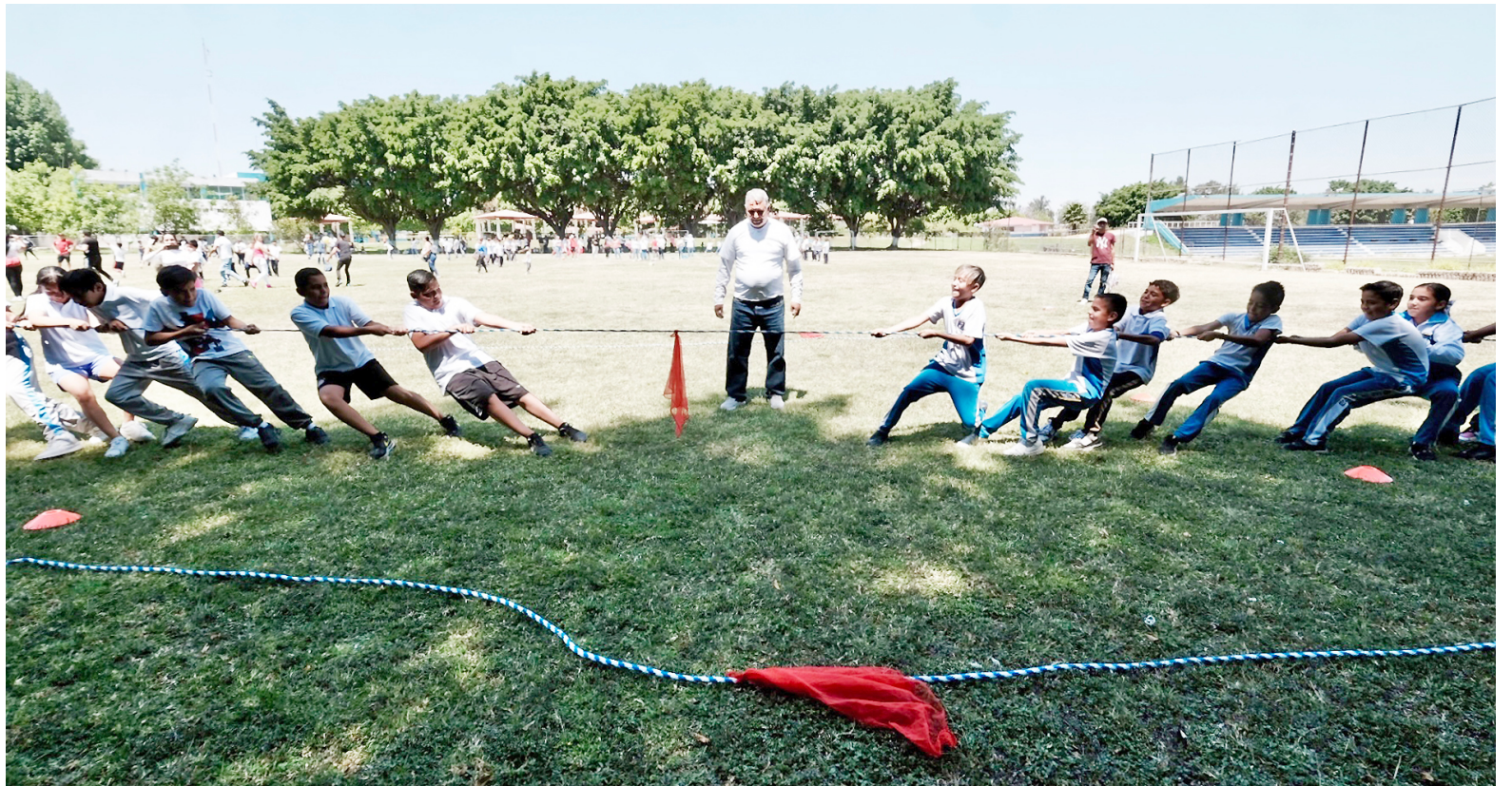
La primera convivencia se realizó en 2022.

Añadió que más allá de la añoranza, estos juegos ayudan a combatir el sedentarismo y favorecen el desarrollo de habilidades psicomotrices y socioemocionales fundamentales para