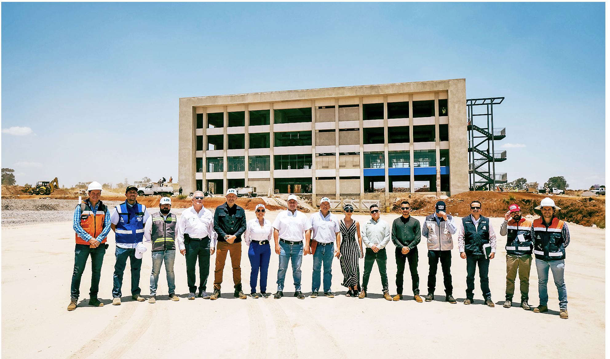
Autoridades realizaron supervisión de obra de la Unidad Académica de Tepatitlán.

El secretario de Infraestructura y Obra Pública, David Zamora Bueno, dijo que la obra del nuevo Instituto Tecnológico Superior de Tepatitlán tiene un avance del 68 por ciento, y que tendrá instalaciones deportivas de primer nivel, estacionamiento, y todos los servicios que demanda un centro universitario de este nivel.