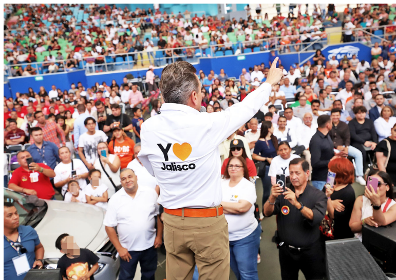
Pablo Lemus destacó los logros alcanzados en la gestión de MC, como el incremento salarial y la capacitación laboral.

El candidato a la gubernatura de Jalisco por Movimiento Ciudadano, Pablo Lemus Navarro, participó en el evento de la Confederación Mexicana de Trabajadores (CTM) para conmemorar el Día del Trabajo, donde reafirmó su compromiso en pro de las y los trabajadores y sus familias. Lemus destacó cómo las administraciones emecistas y la coordinación de las instancias obreras, lograron impulsar programas para mejorar las condiciones de las y los trabajadores. Ejemplo de eso fue el incremento del salario de las y los jaliscienses y el fortalecimiento de la productividad y las habilidades laborales.