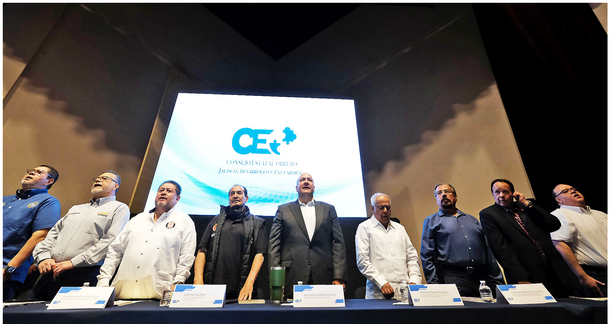
Los trabajadores transportistas de Jalisco y el Consejo Estatal Obrero de Jalisco reconocieron al mandatario estatal.