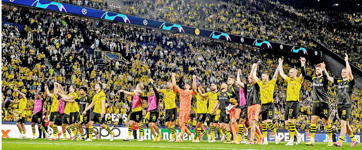
El Borussia Dortmund venció 1-0 al París SG como local en la ida de la Semifinal de la Champions League.

Mientras, Kylian Mbappé caía mucho en fuera de juego y la máquina de Luis Enrique Martínez apenas carburaba. Un tiro de Julian Brandt desde lejos, bloqueado por un zaguero del PSG, fue el aviso a la media hora de que los 'borussers' cocinaban a fuego lento. Dicho y hecho, llegó el