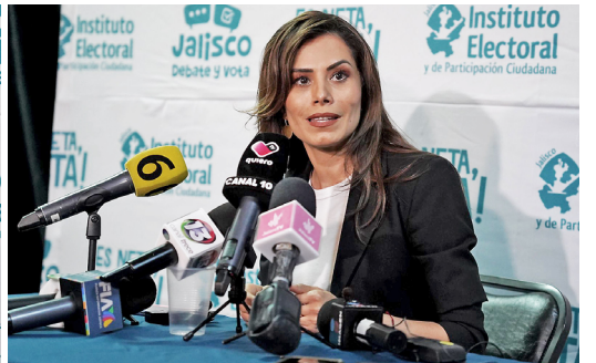
Debate por la presidencia municipal de Guadalajara.

La emecista dijo que ha visitado ya todas las colonias de la ciudad y ante la pregunta de un ciudadano sobre cómo cuidará el medio ambiente en la ciudad, dijo que ella fue una de las senadoras que más trabajó a favor del medioambiente, abogó por la transición energética y agregó que el Gobierno Federal de Morena lastimó este rubro en el país. Por cierto, la abanderada naranja también fustigó al candidato de Morena por ser parte de una red de venta de magistraturas y tener una pensión dorada e ilegal.