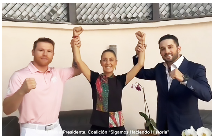
Presidenta. Coalición "Sigamos Haciendo Historia"

"Ahí en lo que podemos ayudar y también estamos disponibles", dijo el púgil. Álvarez alabó las ideas de la candidata, especialmente lo relacionado con invertir en México.