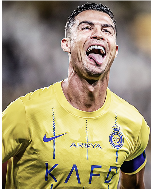
Ronaldo se convirtió en el deportista mejor pagado del mundo tras su fichaje por el Al-Nassr.

C ristiano Ronaldo encabezó la lista Forbes de los deportistas mejor pagados, por cuarta vez en su carrera; mientras, el español Jon Rahm subió al segundo puesto tras su sensacional fichaje por el LIV Golf de Arabia Saudita.