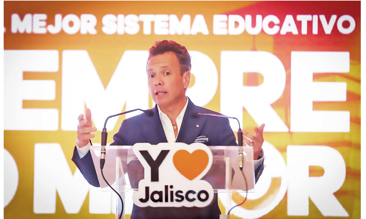
Pablo Lemus presentó una iniciativa elaborada con la colaboración de más de 60 especialistas.

El abanderado del partido naranja subrayó que Jalisco ha construido su propio modelo educativo y destacó la discrepancia en la aportación federal por alumno: mientras que el promedio nacional es de