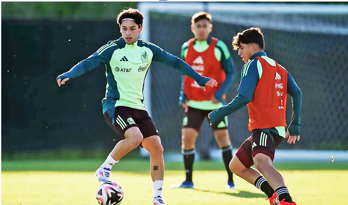
México y Bolivia se verán las caras este viernes 31 de mayo en duelo amistoso en Chicago.

Con la ausencia del guardameta Guillermo Ochoa, quien jugó cinco Copas Mundiales, pero pasa por un momento de baja en su carrera, y sin los atacantes Hirving Lozano y Henry Martín, México jugará la Copa