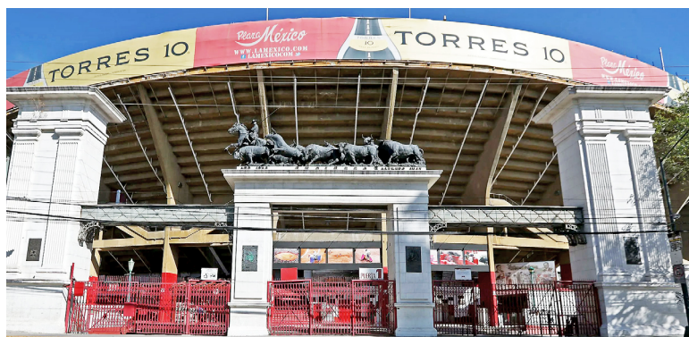
Un tribunal federal revocó la suspensión que impedía corridas desde el pasado 3 de mayo.

La novedad de esta posible prohibición cautelar es que el argumento aceptado por la jueza es "proteger los derechos fundamentales de los toros, caballos y novillos que están en peligro tanto su vida como su integridad", según declara en sus redes sociales Va por Sus Derechos.