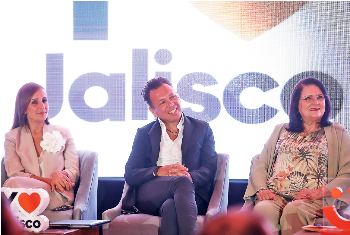
Pablo Lemus se comprometió a presentar alternativas efectivas para el desarrollo social en Jalisco.

Entre los programas presentados destaca Mi Primera Chamba, la ampliación del Programa de Cuidadores para incluir a quienes atienden a las