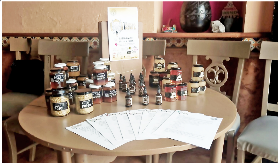
Este jueves 16 de mayo inicia la primera Feria de la Miel en Guadalajara.

En datos ofrecidos por los apicultores, señalaron que para el año 2019 la tasa de deforestación fue de 226 mil 581 hectáreas, la cual se redujo a 174 mil 190 hectáreas en 2020 y a 167