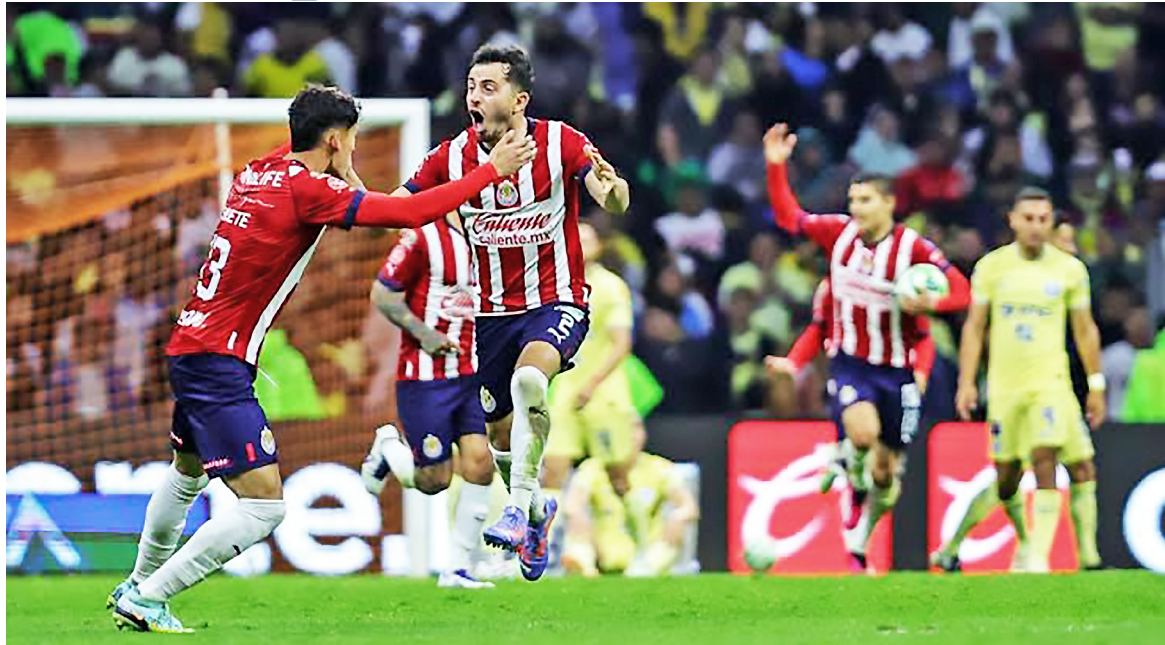
El Clásico Nacional es el principal platillo de las llaves de semifinales del Clausura 2024.

Las Águilas tiene la historia a favor, con cinco triunfos sobre los rojiblancos, pero el Guadalajara ha superado a los azulcremas en las últimas dos ocasiones que se han medido en instancia de eliminación directa en el torneo local. La ida se jugará el miércoles 15 de mayo a las 20:05 horas en el Estadio Akron, mientras que el partido de vuelta será el sábado 18 de mayo a las 20:00 horas en el Estadio Azteca.