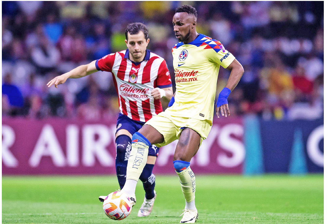
El primer duelo del Clásico Nacional se jugará a las 20:05 horas en el estadio Akron.

Los Rayados se mantienen con vida en el Clausura al despachar en los cuartos de final a los Tigres UANL, en el derbi regional de la ciudad de Monterrey, en tanto el Cruz Azul dejó fuera de la pelea por el título en la fase de los ocho mejores a los Pumas UNAM.